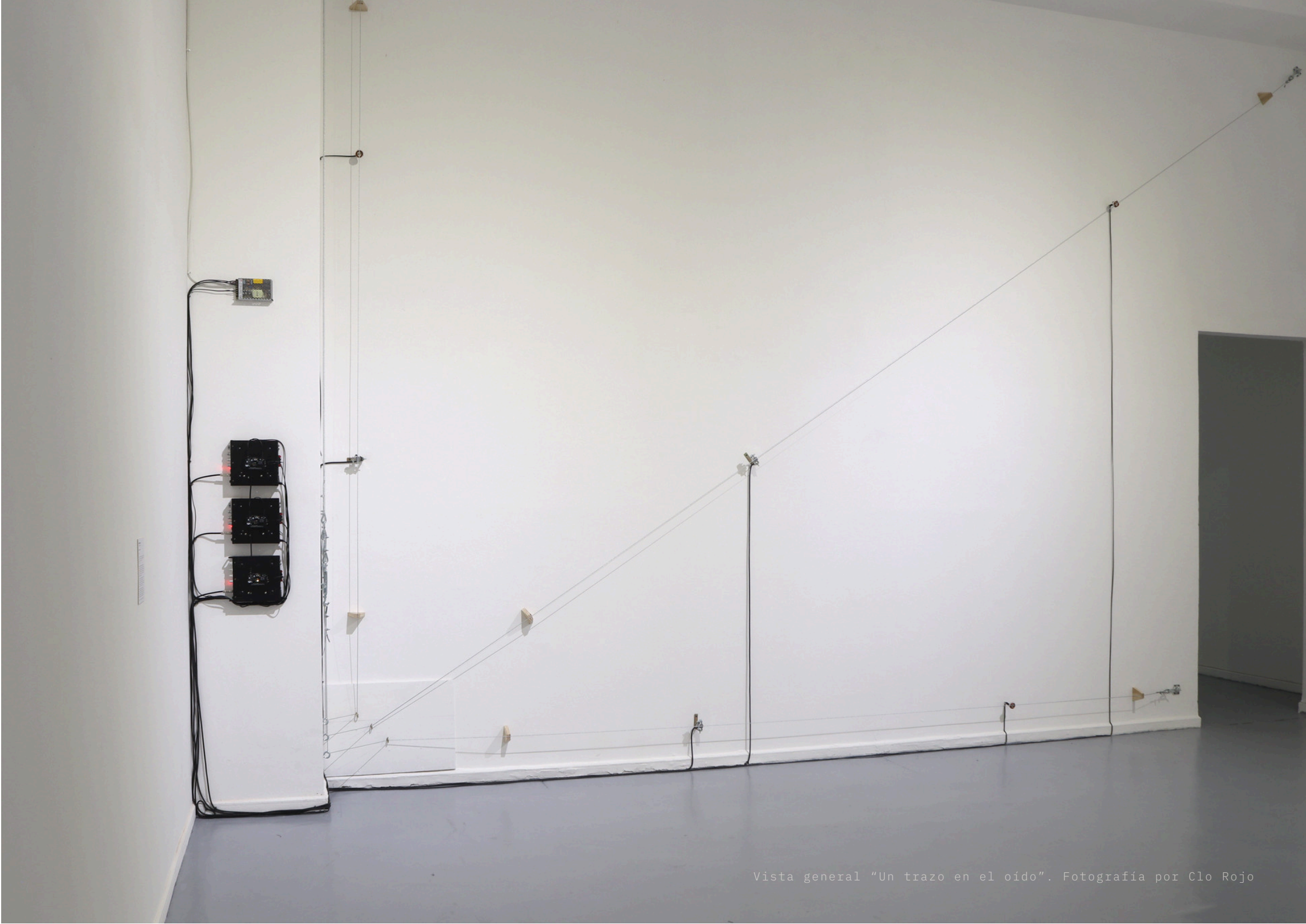
Vista general "Un trazo en el oído".