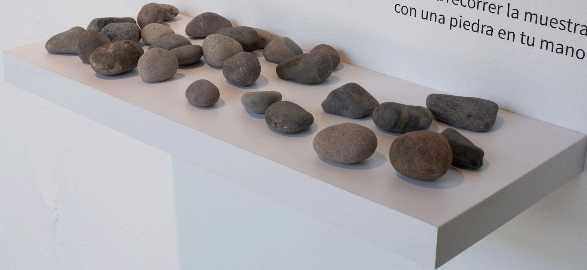
En Amplificar la duda, al ingresar a la sala, se le ofrece al público una piedra.

puedes recorrer la muestra con una piedra en tu mano