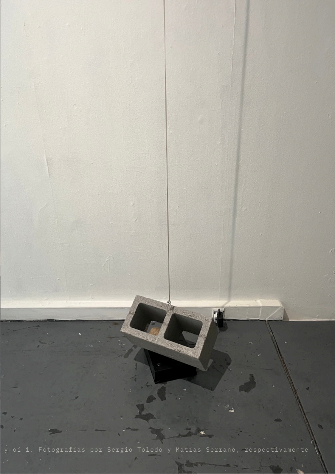
Vistas de oi 3 y oi 1.